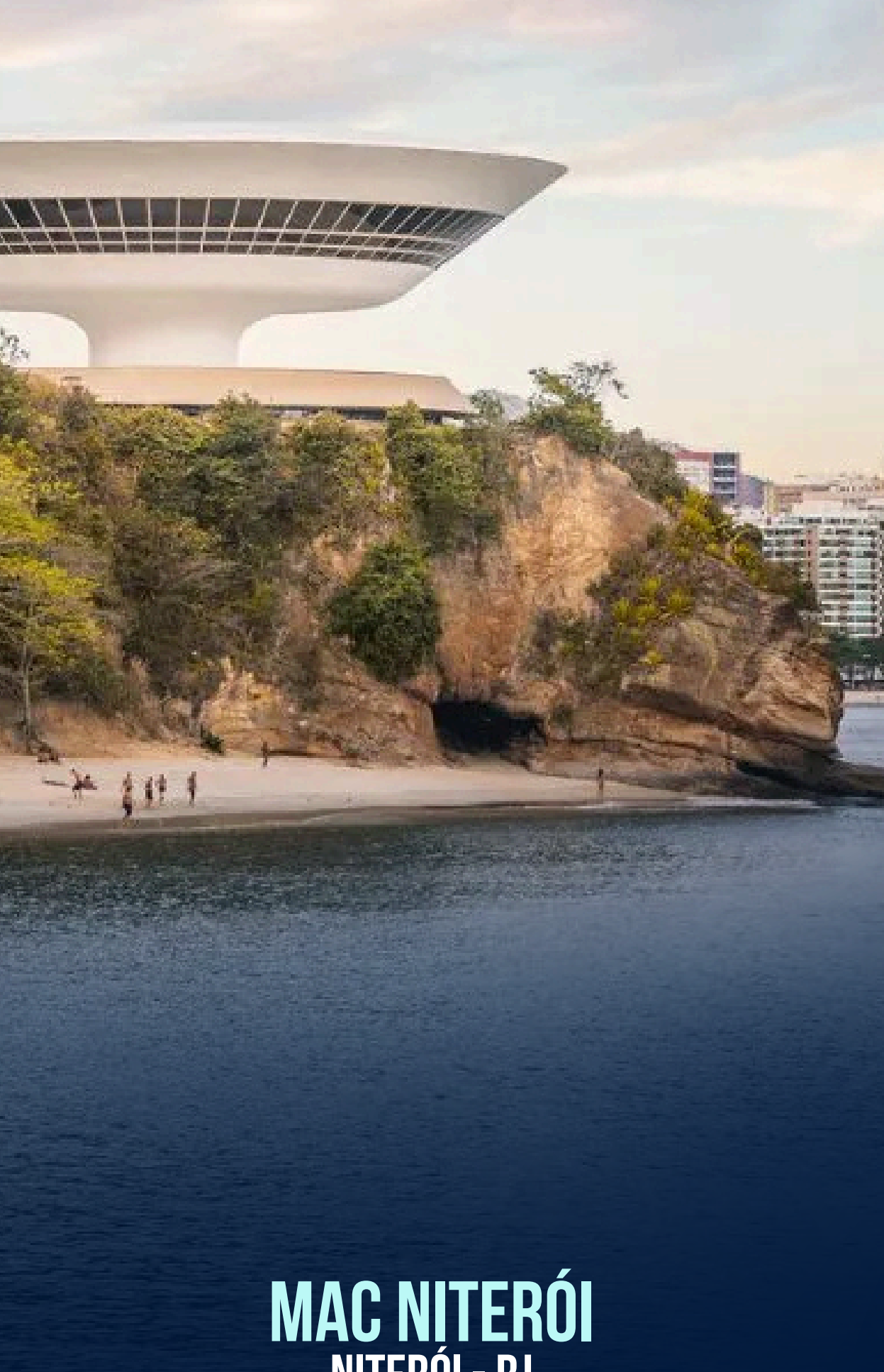
MAC NITERÓI NITERÓI - RJ