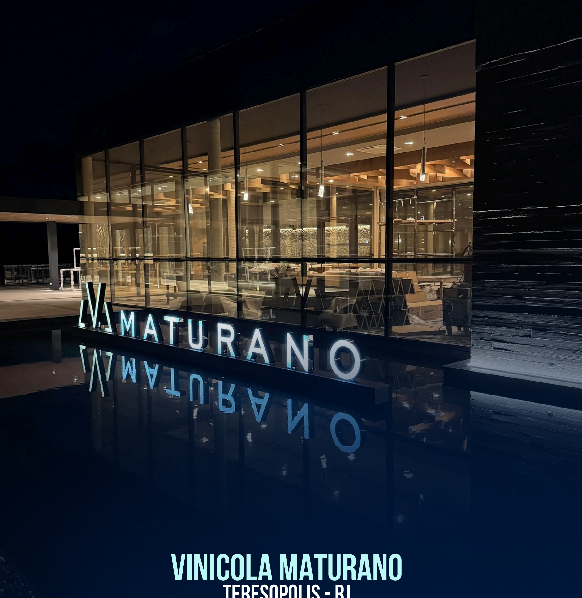
VINICOLA MATURANO TERESOPOLIS - RJ