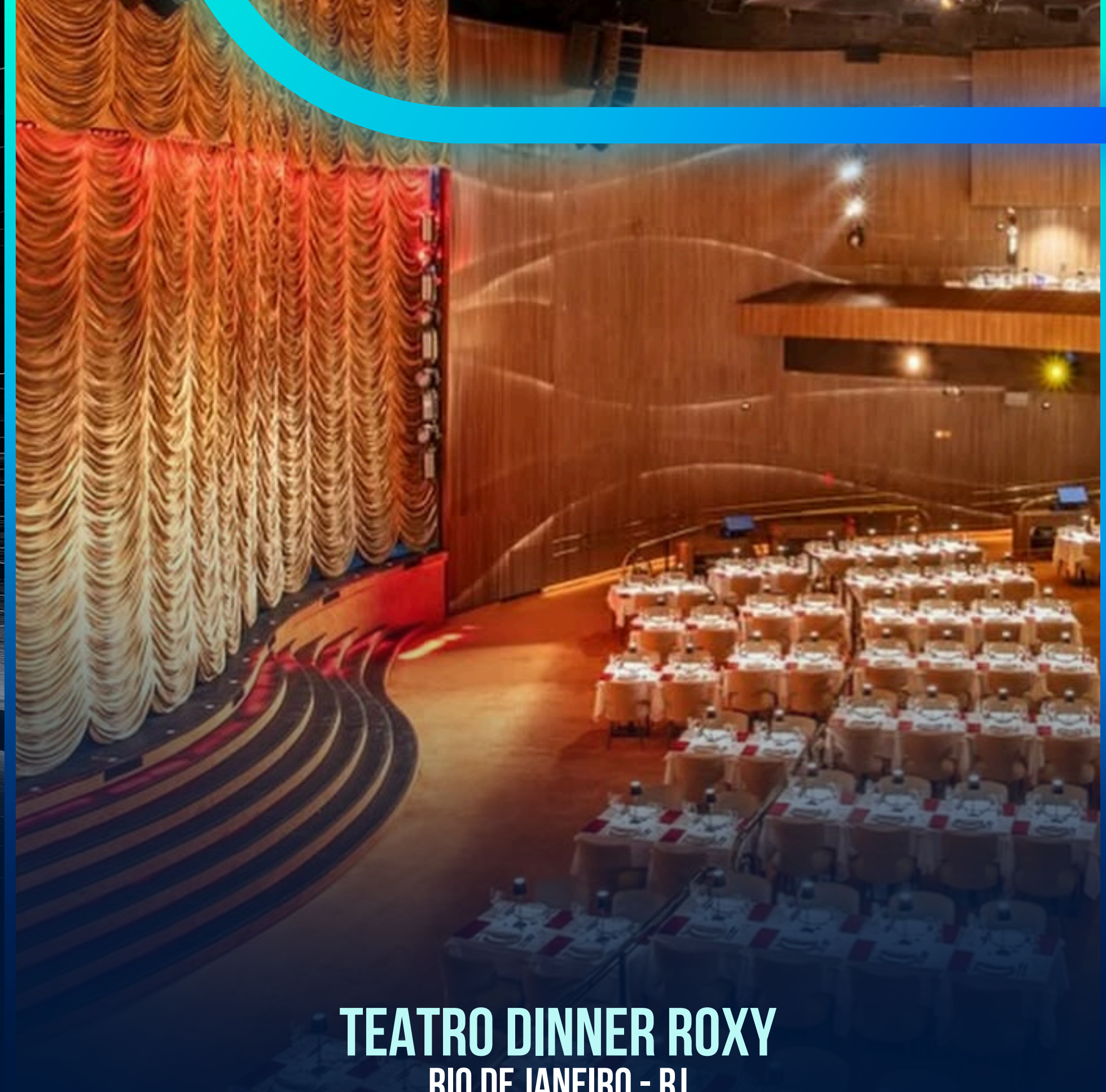
TEATRO DINNER ROXY RIO DE JANEIRO - RJ