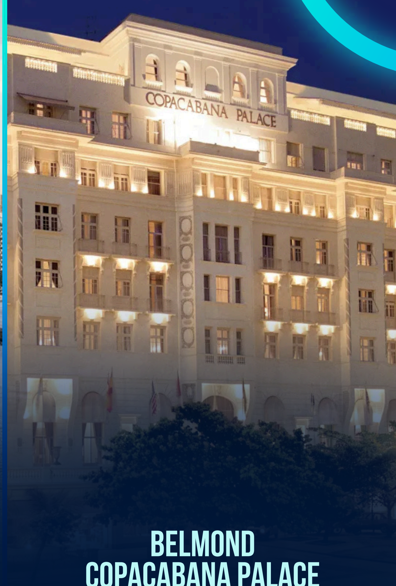
BELMOND COPACABANA PALACE RIO DE JANEIRO - RJ