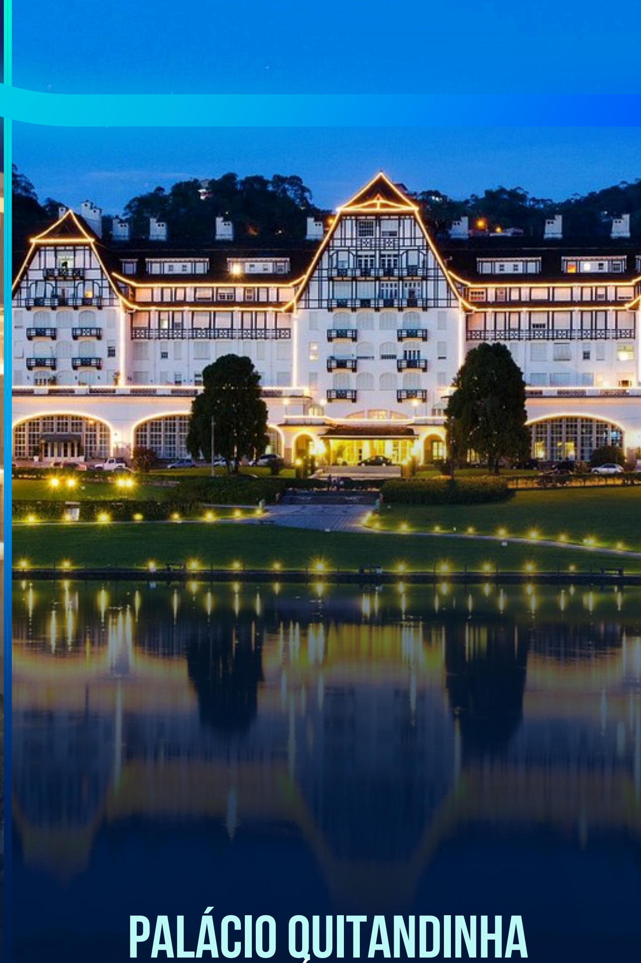
PALÁCIO QUITANDINHA PETRÓPOLIS - RJ