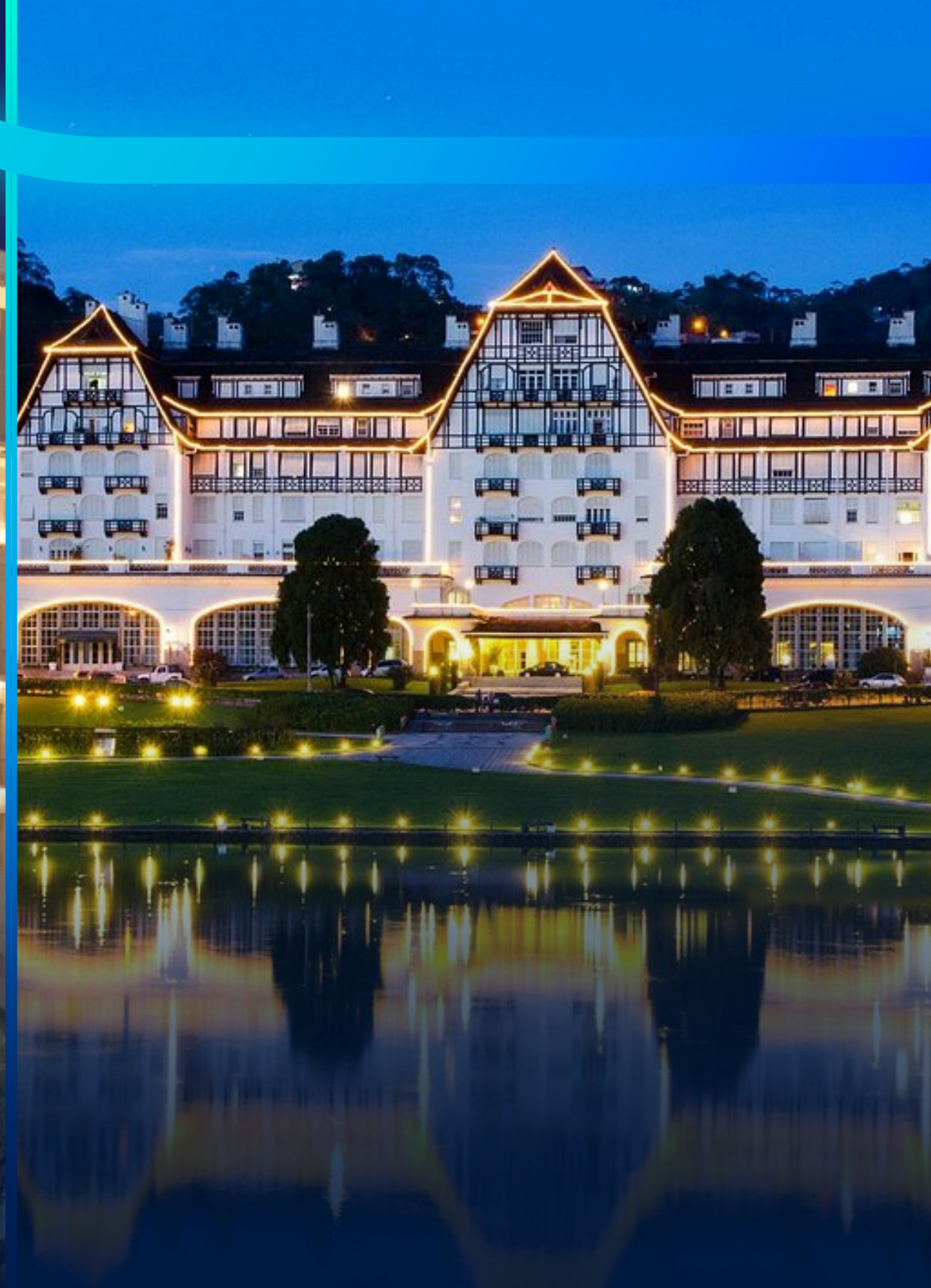
PALÁCIO QUITANDINHA PETRÓPOLIS - RJ