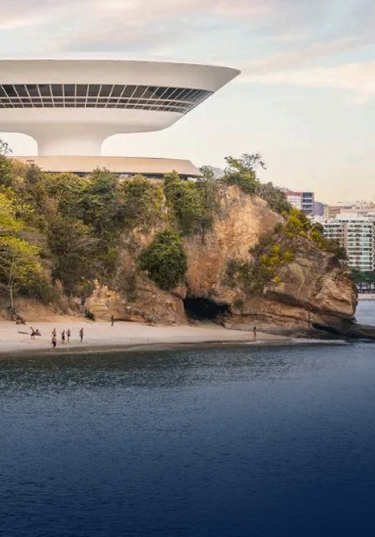
MAC NITERÓI NITERÓI - RJ