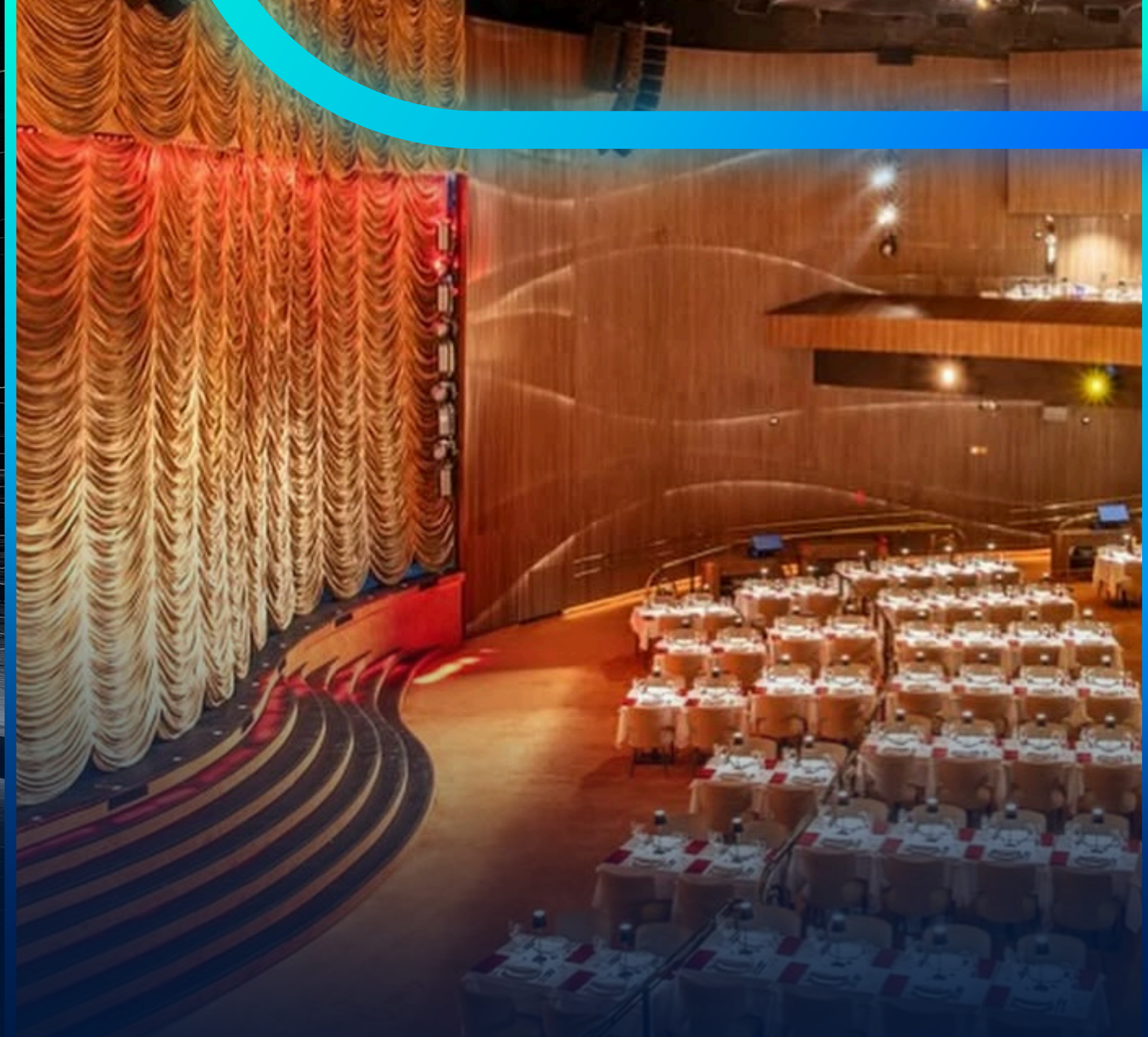
TEATRO DINNER ROXY RIO DE JANEIRO - RJ