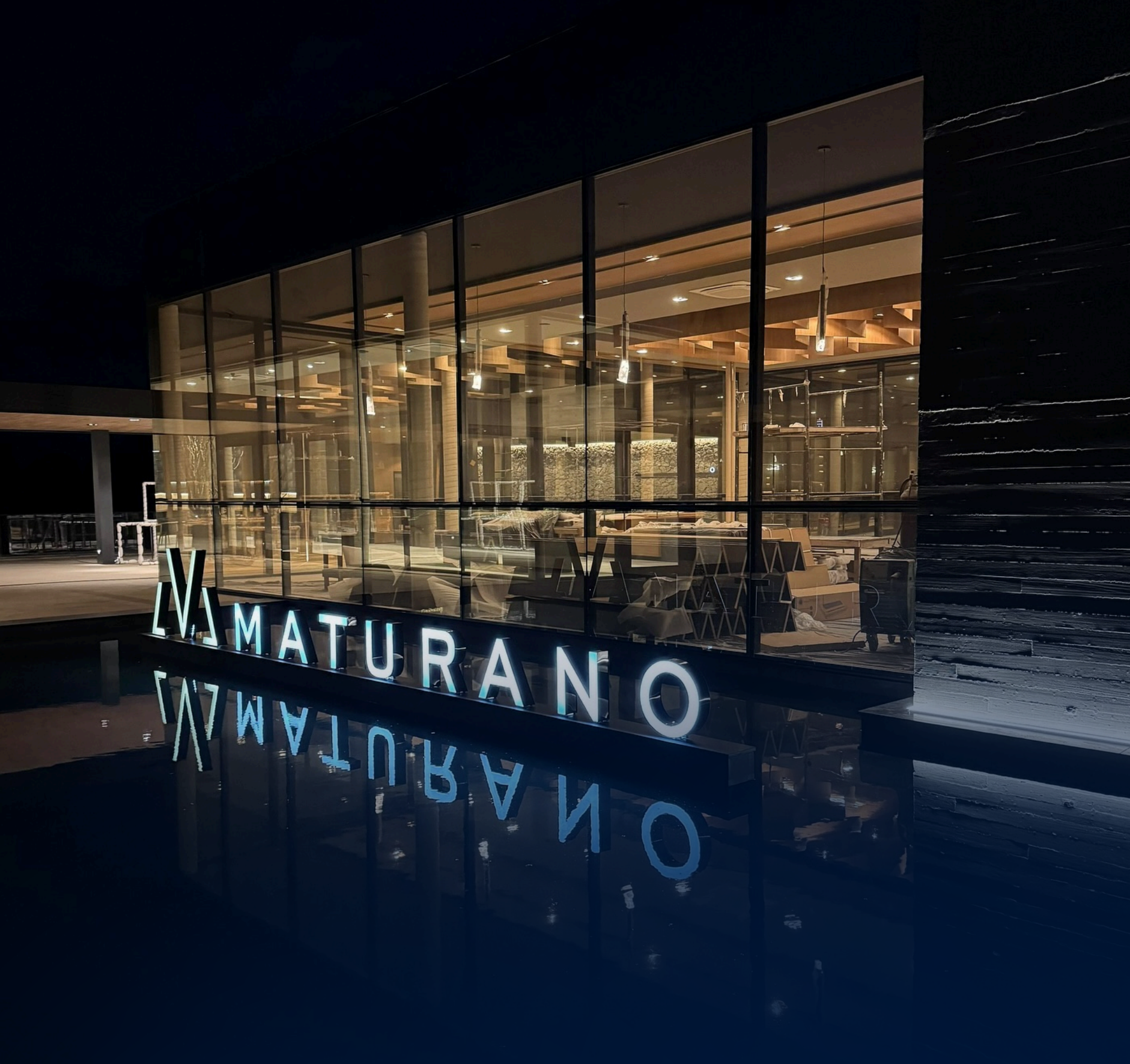
VINICOLA MATURANO TERESOPOLIS - RJ