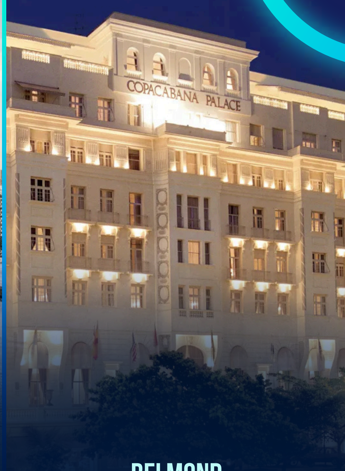
BELMOND COPACABANA PALACE RIO DE JANEIRO - RJ